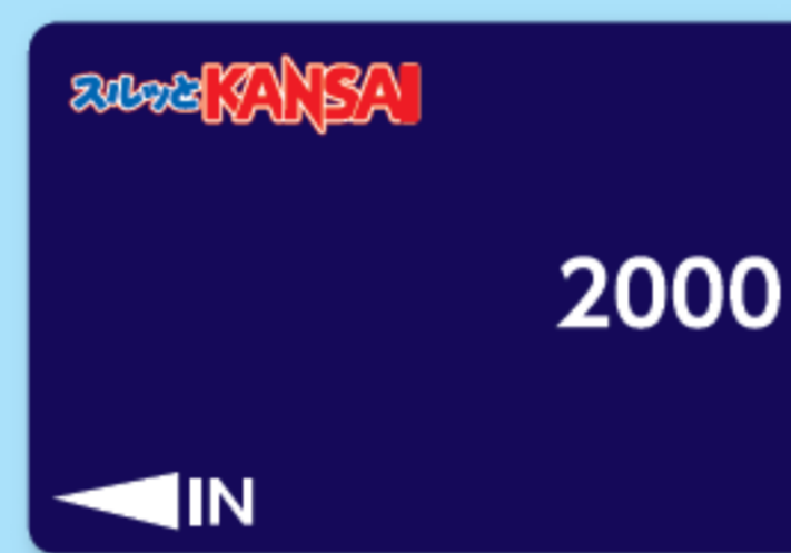
※カードデザインはイメージです

2018年1月31日(水)の営業終了をもちまして、スルッとKANSAI対応カード(共通ロゴスルッとKANSAIが記載)の改札機・バスでの共通利用を終了いたしました。