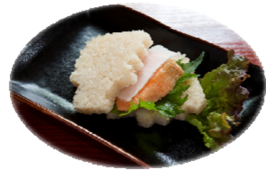
のこぎりライスバーガー