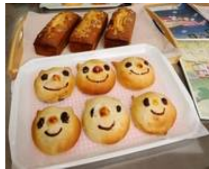
上：ハッピートレインケーキ