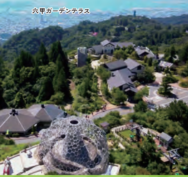
六甲ガーデンテラス

六甲有馬ロープウェイの当日の運行状況は携帯電話からも確認できます 詳しくは左記2次元バーコードを読み取ってアクセスしてください https://koberope.jp/rokko