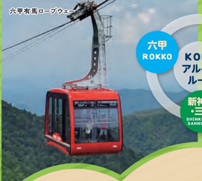
六甲有馬ロープウェイ