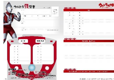
（履歴書デザイン裏）