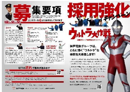
（履歴書デザイン表）